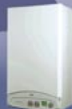
ECO 3 COMPACT